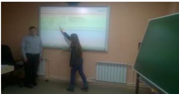
Рисунок 2 - Защита результатов исследования